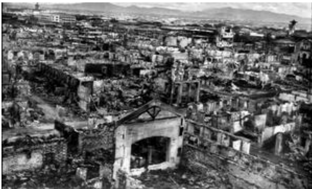
Imagen de la ciudad de Manila en ruinas tras la victoria aliada de 1945