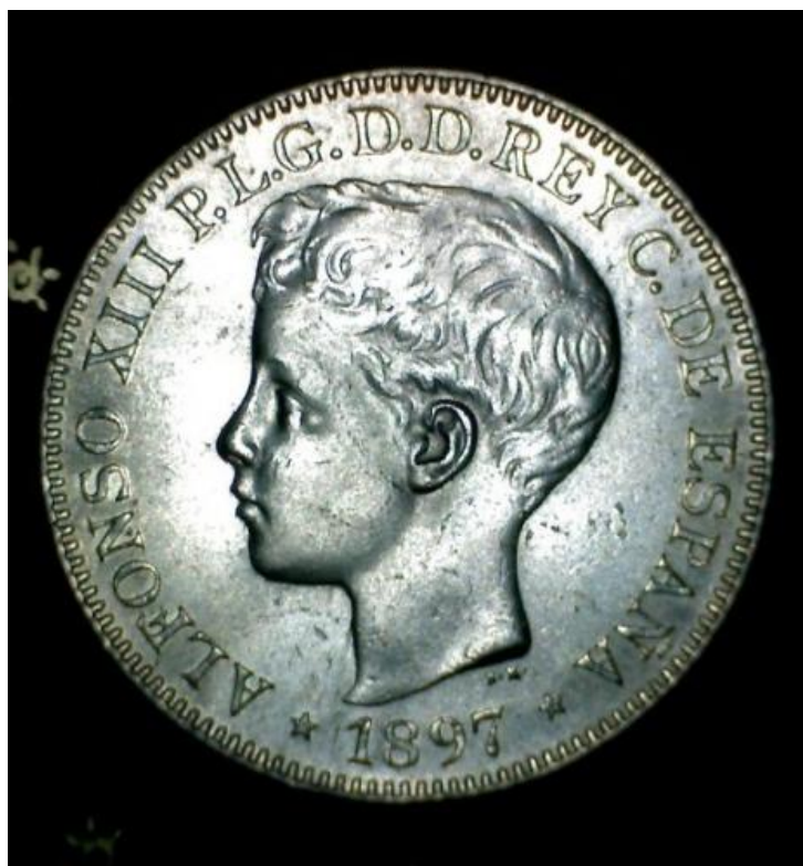
Un peso de plata, Filipinas, 1897.

Tras la publicación del trabajo sobre Martín Cerezo y Los Últimos de Filipinas en semanas pasadas, hoy se dedican estas sencillas líneas en honor de La última de Filipinas y con ello y en su figura y recuerdo quiero representar a los españoles olvidados en la masacre de españoles en la liberación de Manila que tuvieron en la Navidad de 1944-45 la última de su vida.