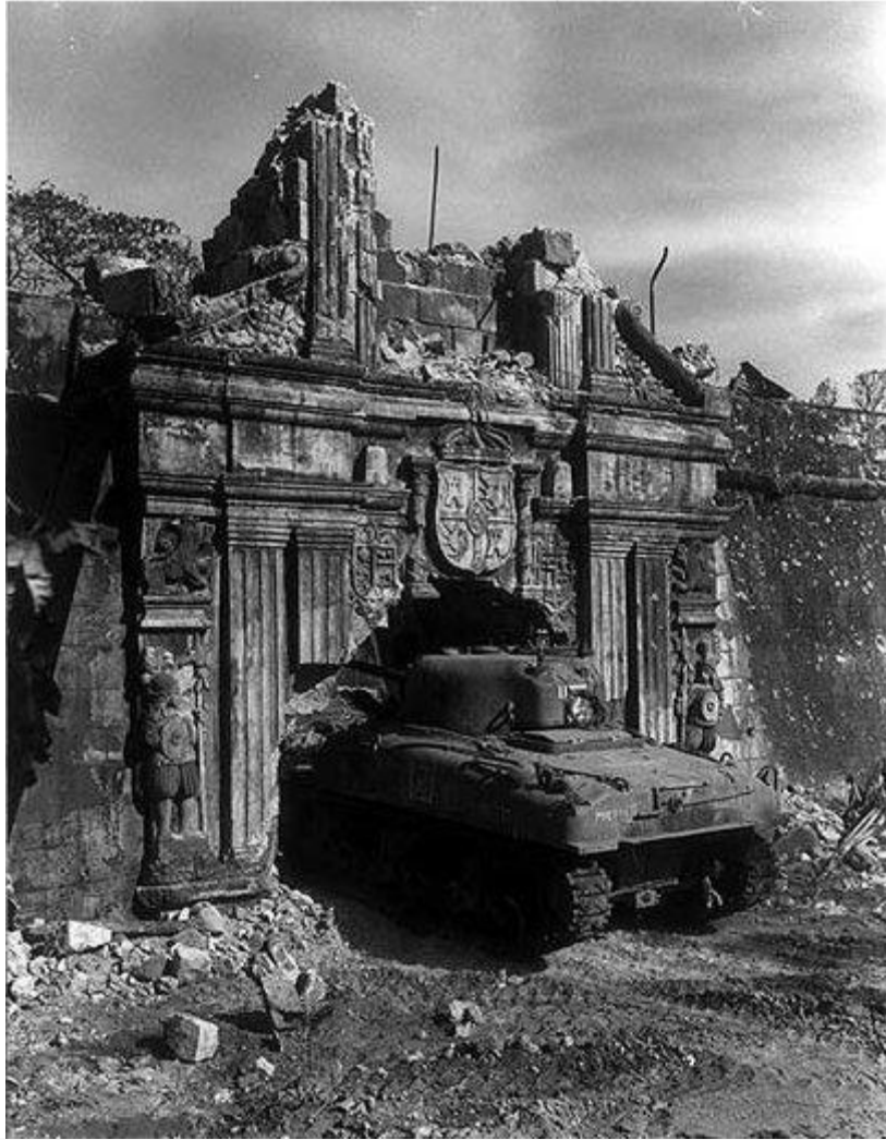
Un tanque estadounidense M4 Sherman atraviesa las ruinas de la puerta del Fuerte Santiago, Intramuros, el 8 de febrero de 1945, pasando bajo el escudo pequeño con las armas de España.