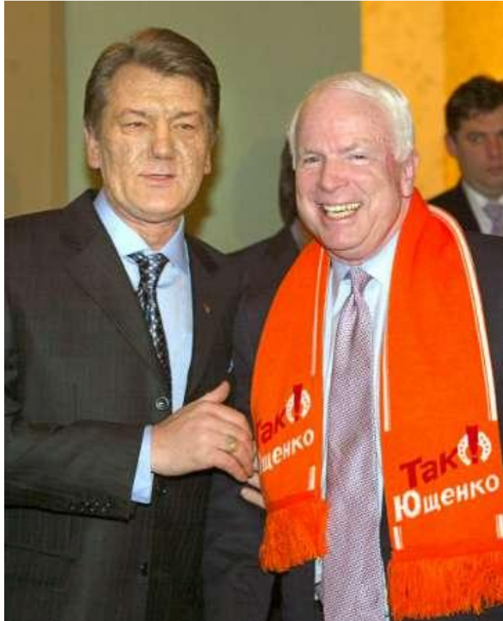
Yushchenko y McCain (febrero 2005)

El senador estadounidense también viajó a los países árabes «primaverizados»: Túnez (21 de febrero de 2010), Egipto (27 de febrero de 2011), Libia (22 de abril de 2011) y Siria (27 de mayo de 2013). En los dos primeros viajes los gobiernos ya habían caído. En los dos últimos la batalla causaba estragos (aún continúa causándolos en Siria).