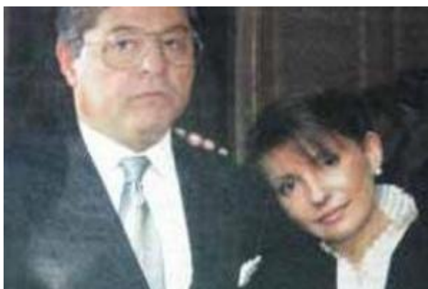
Lazarenko y Timochenko

es nombrado viceprimer ministro encargado de la energía. Los resultados de SEUU se disparan, sin duda beneficiados por las armas políticas inherentes al puesto de Lazarenko: ¡10.000 millones de dólares de volumen de negocios y 4.000 millones de dólares en el año 1996! Y todo ello gracias a unos contratos muy lucrativos vinculados a la venta en Ucrania de gas natural ruso [48]. Los años de bonanza continúan con la promoción de Lazarenko al puesto de primer ministro en mayo de 1996, aunque se libraría de un atentado con bomba apenas dos meses después [49]. A principios de 1997 la SEUU controlaba varios bancos, tenía participaciones en decenas de empresas de metalurgia y de construcción mecánica, era copropietaria de la tercera mayor compañía aérea de Ucrania y de su segundo mayor aeropuerto, el de Dnipropetrovsk, además de participar en el desarrollo de gaseoductos turcos y bolivianos, y de controlar varios periódicos locales y nacionales [50].