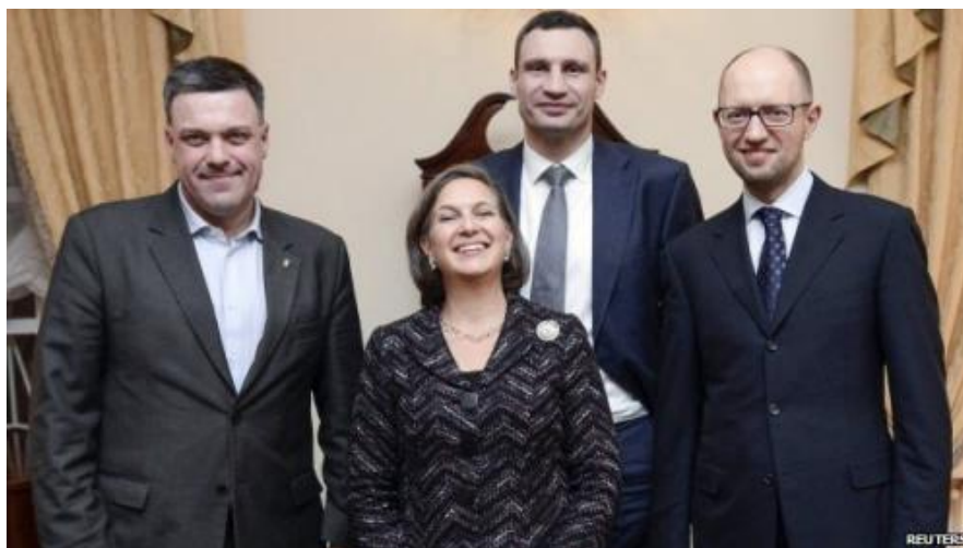
Tiagnibok, Victoria Nuland, Klitschko y Yatseniuk

¿Y cómo llama Victoria Nuland, la subsecretaria de Estado para Europa y Eurasia, a los líderes del Euromaidán? ¿«Yats» y «Klitsch»? (72) ¿Como «Jon» y «Ponch», de la popular serie estadounidense CHiPs? Lo menos que se puede decir es que la utilización de un lenguaje tan familiar demuestra una proximidad evidente y una connivencia innegable entre los miembros del triunvirato y la administración estadounidense.