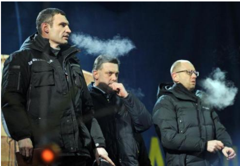
Los líderes del «Grupo de Acción para la Resistencia Nacional»: Klitschko, Tiagnibok y Yatseniuk

Y para reforzar el poder del nuevo poder sobre las instituciones ucranianas, Oleg Mahnitsky acaba de ser nombrado fiscal general de Ucrania, puesto de una importancia capital en este periodo de sobresaltos «revolucionarios» y de evidentes arreglos de cuentas «democráticos». Una pequeña precisión: Mahnitsky es miembro del partido Svoboda [28]. ¿La guinda del pastel? En el nuevo gobierno post-Euromaidán ampliamente dominado por el partido Batkivshina de Timochenko, se han concedido tres carteras a miembros de Svoboda: Oleksandr Sych, viceprimer ministro; Andriy Mokhnyk, ministro de Medio Ambiente y Oleksandr Myrnyi, ministro de Agricultura [29].