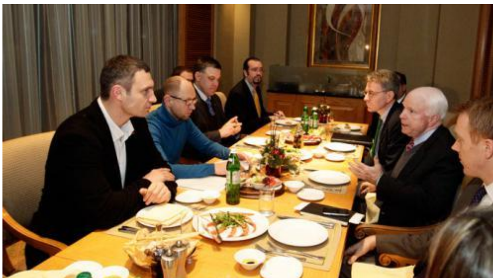
McCain se entrevista con Klitschko, Yatseniuk y Tiagnibok (diciembre de 2013)

La injerencia estadounidense también se ve claramente en el «asunto Nuland», que demostró que el vocabulario diplomático utilizado por algunos altos funcionarios estadounidenses no tiene nada que envidiar al de los carreteros, «¡Fuck the UE!» [¡Qué se joda la UE!] exclamó, lo que dice mucho de la lucha de influencia que enfrenta al Tío Sam con el viejo continente.