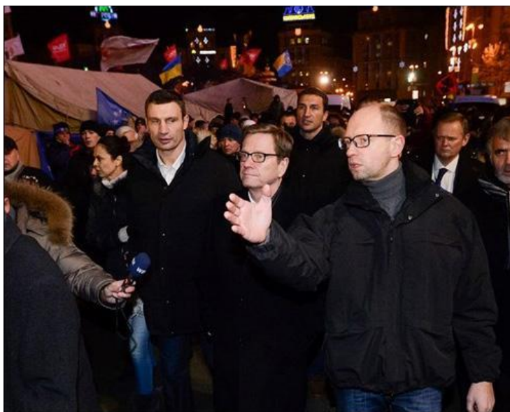
Klitschko, Guido Westerwelle y Yatseniuk

El segundo país occidental ampliamente implicado en el Euromaidán es Alemania. Unos doce días antes que McCain, Guido Westerwelle, el jefe de la diplomacia alemana, se dio un baño de multitudes en medio de los manifestantes de la plaza Maidán en compañía de sus «protegidos», «Yats» y «Klitsch», o más finamente Yatseniuk y Klitschko. Tras entrevistarse con ellos a puerta cerrada declaró: «No estamos aquí para apoyar a un partido, sino que apoyamos los valores europeos. Y cuando nos comprometemos con esos valores europeos naturalmente nos agrada saber que la mayoría de los ucranianos comparten esos valores, que quieren compartírselos y desean seguir la vía europea» (79). Hablando de mayoría, ciertamente Westerwelle no ha consultado los recientes sondeos que muestran que solo el 37% de la población ucraniana es partidaria de la adhesión de su país a la Unión Europea (80). Por otra parte, ¿son ciudadanos europeos? No es tan seguro. Por ejemplo, una encuesta reciente muestra que el 65% de los franceses se opone a la idea de una ayuda financiera aportada por Francia y la Unión Europea a Ucrania, y un 67% está en contra de la entrada de este país en la UE (81).