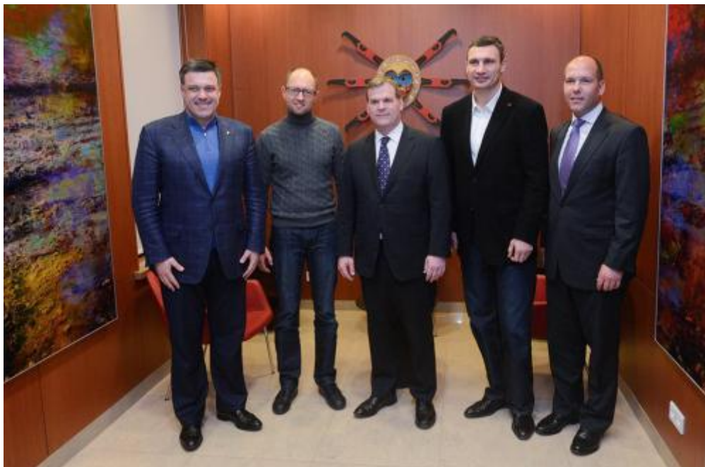
Tiagnibok , Yatseniuk, Baird, Klitschko y Grod

Yatseniuk y la «Juana de Arco» ucraniana. Preguntado sobre su apoyo «incondicional» a Ucrania y sus consecuencias sobre las relaciones con Rusia respondió: «Ciertamente no vamos a disculparnos por apoyar al pueblo ucraniano en su lucha por la libertad» (86). Hay que señalar que Paul Grod, el presidente de los ucranianos-canadienses (UCC) acompañó a Baird en sus dos viajes. Sus posturas son calcadas a las de la diplomacia canadiense.