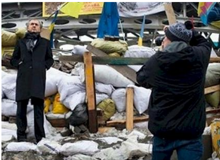
BHL posant à Kiev

Para contradecir al «dandy» de camisas blancas escotadas, veamos qué dice la ucraniana Natalia Vitrenko, presidenta del Partido Socialista Progresista de Ucrania: «Al principio [los cabecillas] eran los diputados de la oposición Yatseniuk, Klitschko y Tiagnibok. Estos tres personajes encabezaban el Maidán. Pero a continuación tomó las riendas el Pravy Sektor. Desde mediados de diciembre la política del Maidán la decidía Pravy Sektor, que es una alianza de diferentes partidos y movimientos neonazis. Son grupos paramilitares, terroristas muy bien adiestrados» [45].