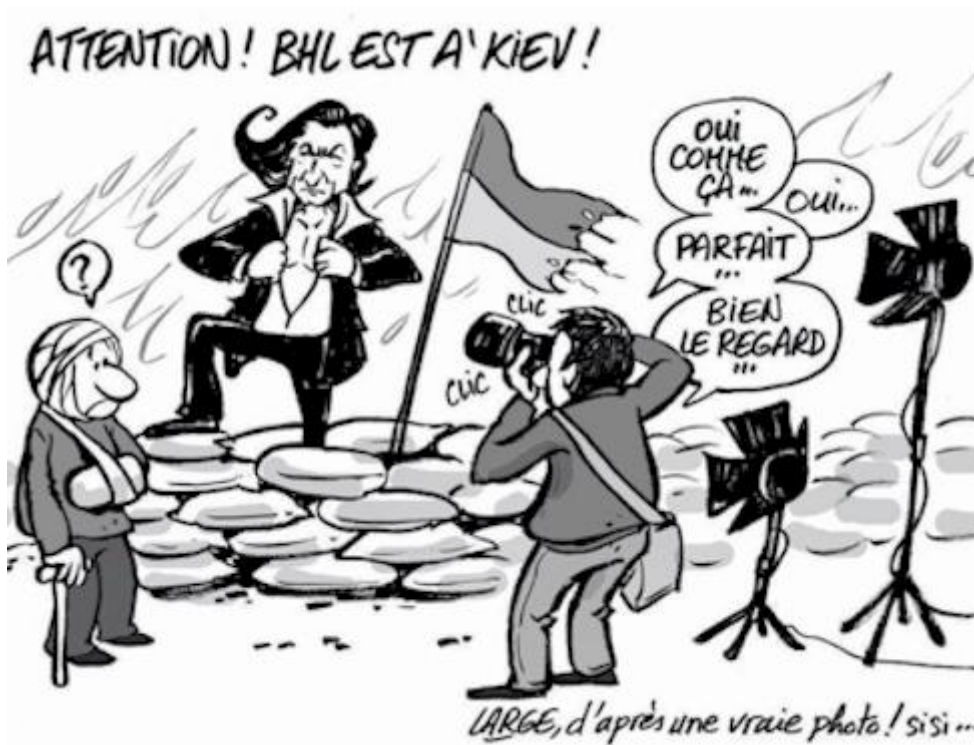
Caricature de "l'événement"