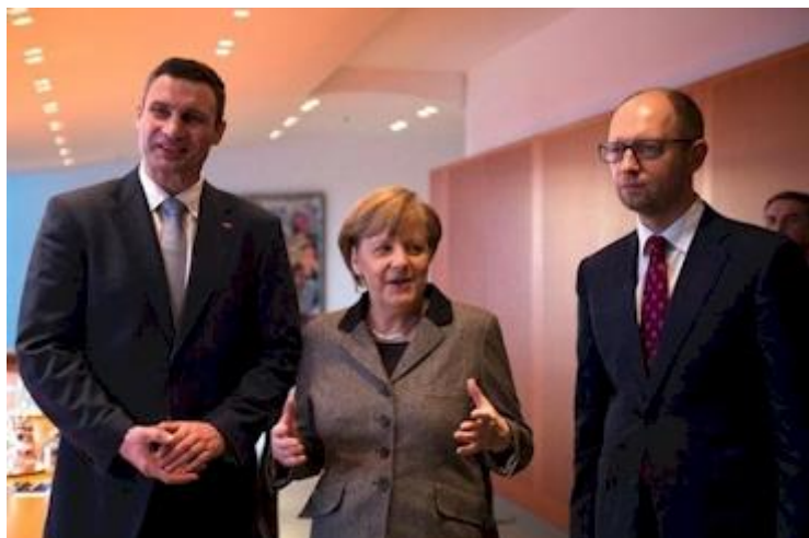
Klitschko, Merkel y Yatseniuk

Por otra parte, la canciller alemana, al igual que su ministro, recibió a Yushchenko y Klitschko el 17 de febrero de 2014 en Berlín. El candidato por el que apuestan Merkel, el CDU y su think tank , la Fundación Konrad Adenauer, es Klitschko (82). Sin embargo, el partido de Timochenko también está considerado un aliado del PPE y del CDU, lo que afirmó Martens en un discurso en el Club de la Fundación Konrad Adenauer en 2011: « Julia Timochenko es una amiga de confianza y su partido es un miembro importante de nuestra familia política ». En ese mismo discurso declaró que su postura era similar a la de McCain en cuanto al apoyo a Timochenko (para liberarla cuando estaba en prisión) (83).