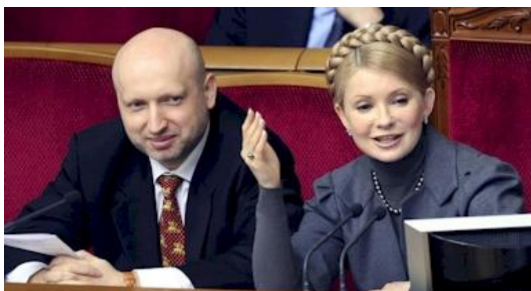
Olexandre Turtchinov y Julia Timochenko

En primer lugar está «Batkivshina» o Unión Panucraniana «Patria» que es un partido político cuyo líder es Julia Timochenko, secundada por Olexandre Turtchinov, un viejo amigo considerado su «fiel escudero» [16]. Este último es quien ha sido nombrado presidente interino de Ucrania tras la partida de Yanukovich.