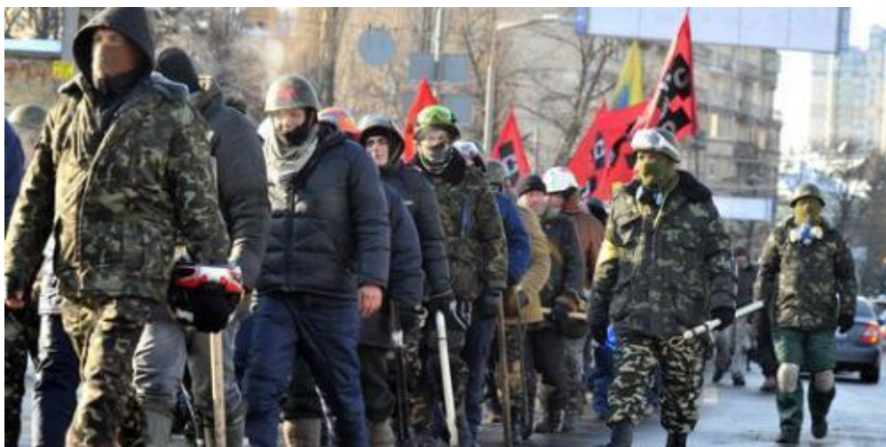
Milicias de autodefensa organizadas por el grupo de extrema derecha Pravy Sektor

Nadie puede decir si ha triunfado la revolución ni siquiera si esta insurrección se puede considerar tal cosa. Pero de lo que se está seguro es que el gobierno ha caído verdaderamente y de que se ha nombrado a Dmitro Yarosh adjunto al presidente del Consejo de Seguridad y de Defensa Nacional de Ucrania [40], un organismo consultivo de Estado encargado de la seguridad nacional que depende del presidente del país. ¿Y quién es el presidente de este consejo? No es otro que Andriy Parubiy, «el comandante de Maidan» [41], «el jefe del Estado mayor de la revolución ucraniana» [42] que durante la «revolución» guardó su ropa de diputado del partido Batkivshchyna para ponerse la de «generalísimo» del «ejército» de los amotinados del Euromaidan. Pero lo más interesante es saber que Parubiy es un tráfuga del partido Svoboda. En efecto, junto con Oleg Tiagnibok cofundó en 1991 del Partido Nacional-Socialista de Ucrania (SNPU), rebautizado Svoboda en 2004 [43]. Esto demuestra que en Ucrania las barricadas, los altercados, la desobediencia civil, la violencia y el fascismo pueden llevar muy alto.