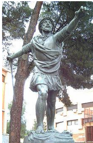
Estatua de Núñez de Balboa en Madrid (Enrique Pérez Comendador, 1954).

Más tarde sería Gobernador de Veraguas hasta oír de la existencia de otro mar en un relato sobre un reino al sur donde la gente era tan rica que utilizaban vajillas y utensilios en oro para comer y beber.