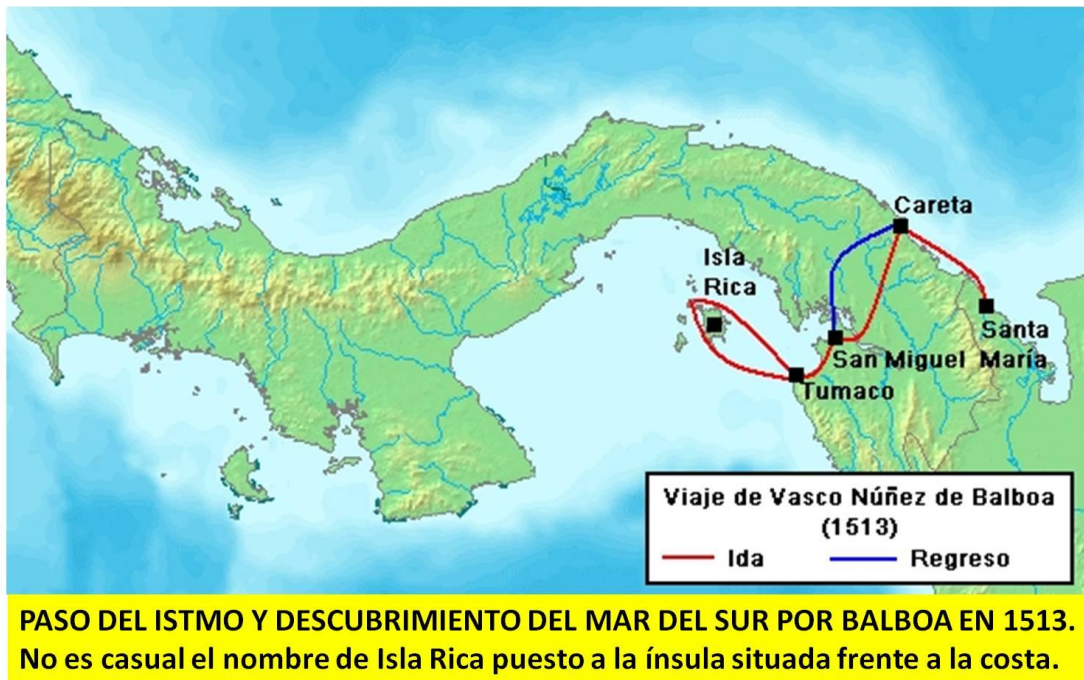
Ruta del viaje de Balboa

Desde allí en persecución del mito decidió embarcarse en canoas, a pesar de que era octubre y las condiciones climáticas no eran las mejores. Divisó unas islas, y llamó Isla Rica a la mayor de éstas; y a todas Archipiélago de las Perlas , nombre que aún permanece.