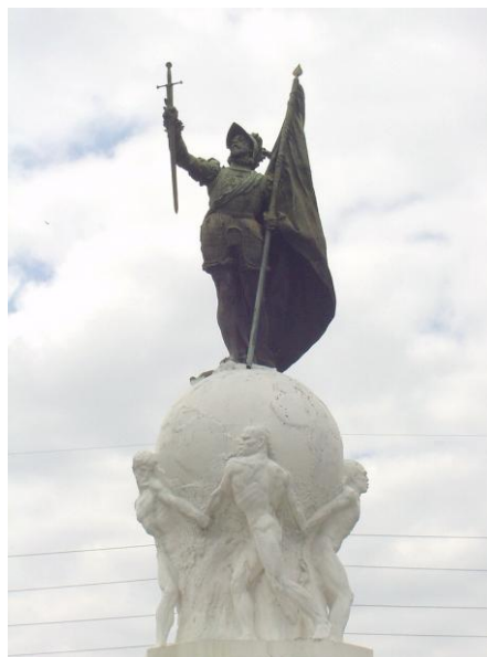
Monumento a Balboa en Panamá

Balboa nace en Jerez de los Caballeros y llega a América acompañando a Rodrigo de Bastidas en sus exploraciones por el Caribe. Motivado por historias de los habitantes de las nuevas tierras, que hablaban de un mar para ellos desconocido, emprendería una titánica marcha en su búsqueda.