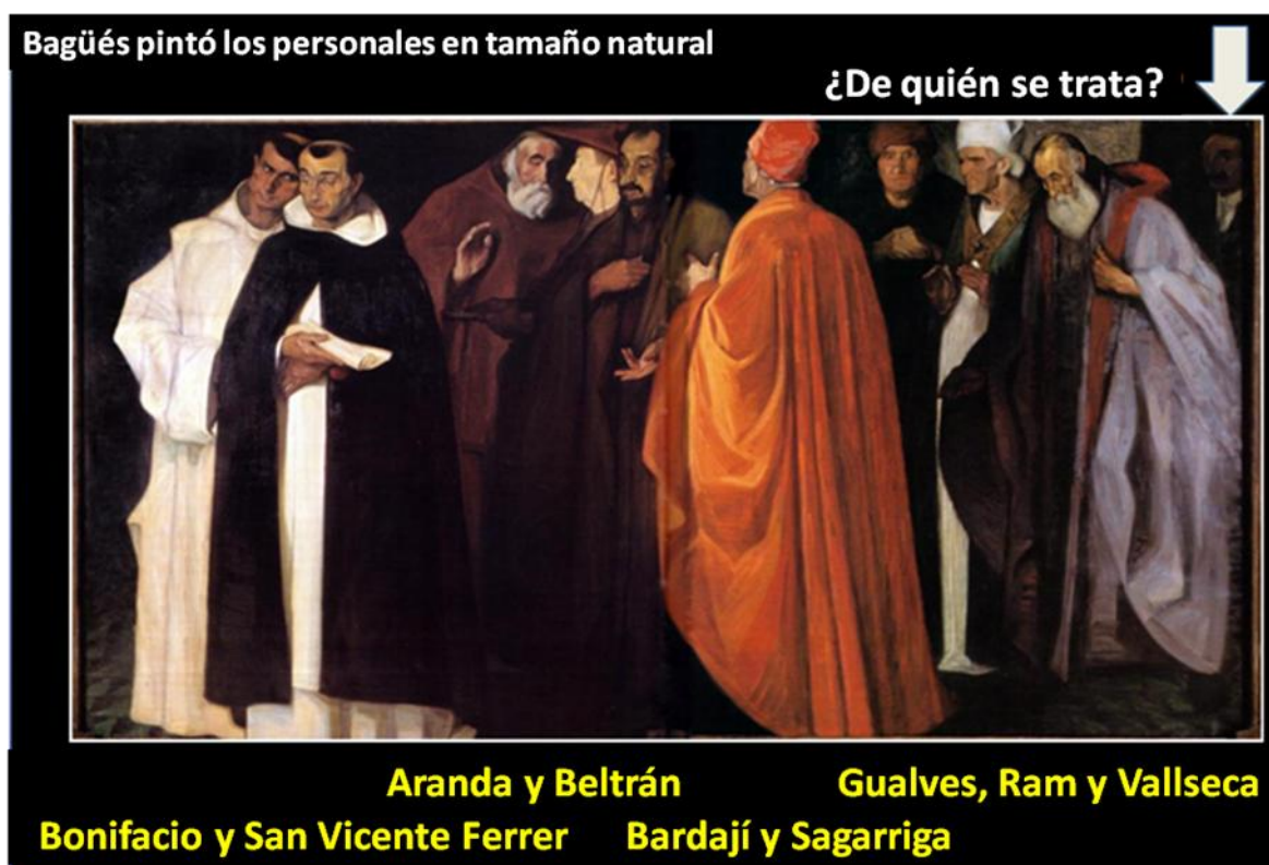
Cuadro expuesto al público en la Diputación de Zaragoza

Los compromisarios no eran grandes nobles ni guerreros, sino expertos en moral y en leyes. Se les encargó obrar en conciencia y resolver según el derecho y la mejor conveniencia de la Corona, para garantizar su libertad de acción, fueron congregados en suelo aragonés, en el castillo de Caspe, de la orden militar de San Juan de Jerusalén, dotando a la localidad de un fuero temporal especial bajo la autoridad de los Nueve.