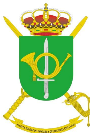
Clásico distintivo de brazo de OE,s. y escudo de armas de la EMMOE,s.