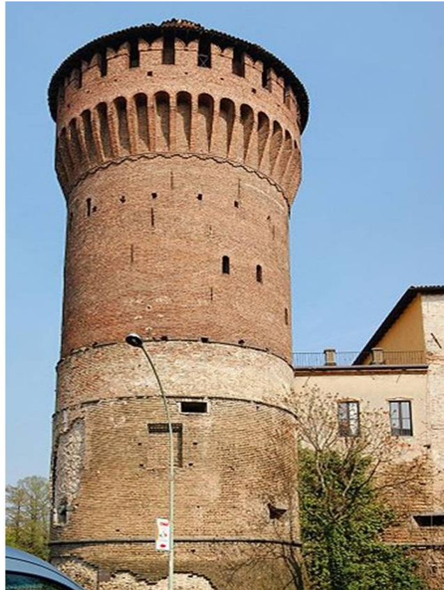
TORREÓN DE LODI PUNTO DE PARTIDA DE LA MARCHA DE APROXIMACIÓN EN LA ENCAMISADA DE MELZO

La voz encamisada se ha venido utilizando hasta la actualidad para definir cualquier acción por sorpresa, tipo golpe de mano, pero el origen real de porqué se empleó esa palabra se ha ido olvidando. Su origen está en las acciones desarrolladas por el Marqués de Pescara y el marqués del Vasto en tierras italianas y que se encuentran relatadas y detalladas en el testimonio de fray Juan de Oznayo que sirvió al marqués del Vasto como paje de lanza antes de ordenarse como religioso.