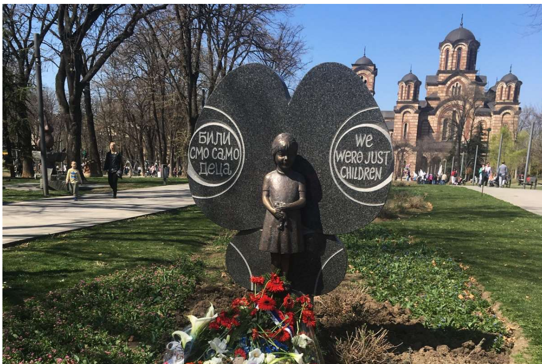
Monumento a 79 niños serbios muertos durante el bombardeo de Serbia por la OTAN en la primavera de 1999

La lista de todos los serbios asesinados y expulsados de Kosovo en los primeros años después del 10 de junio de 1999 es, por desgracia, demasiado largo para este artículo y, por lo tanto, aquí se va a presentar sólo los casos más terribles que los medios corporativos occidentales generalmente han ignorado sistemáticamente: