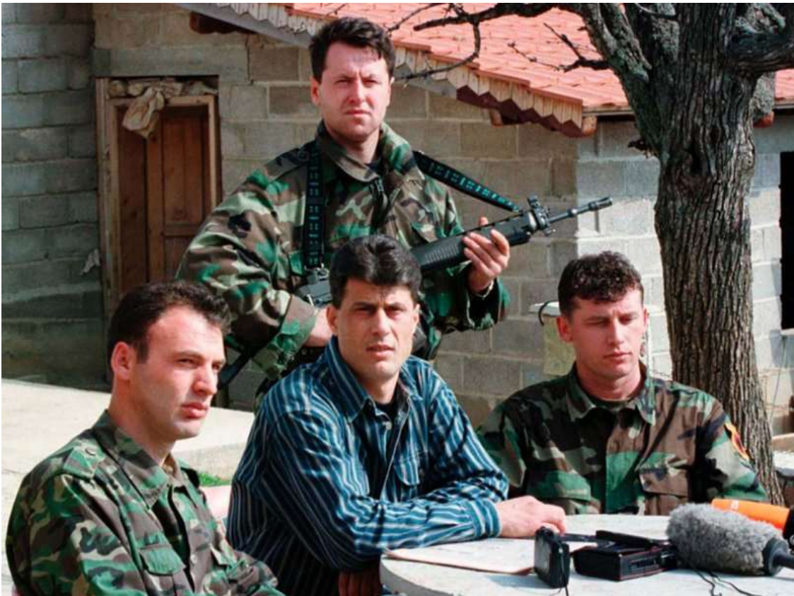
Thaci, centro, entonces comandante de alto rango en el grupo guerrillero del Ejército de Liberación de Kosovo, se dirige a una conferencia de prensa en 1999 en un lugar secreto en el centro de Kosovo.

apartheid abierto masivo de Albania en Kosovo seguido de la organización y funcionamiento del cuasi-estado clandestino ilegal del Kosovo albanés. La política separatista albanesa finalmente se desenmascaró el 7 de septiembre de 1990, cuando los parlamentarios albaneses de Kosovo en su reunión secreta en la ciudad de Kačanik (en la misma frontera con la Macedonia yugoslava) adoptaron una nueva Constitución para la República independiente de Kosovo, que tenía que ser un estado soberano entre las otras naciones de una Yugoslavia ya hundida. Como reacción, el gobierno serbio puso a Kosovo bajo su control político total.