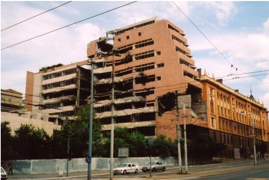
Edificio del Ministerio de Defensa yugoslavo dañado durante el bombardeo de la OTAN, Belgrado, Serbia